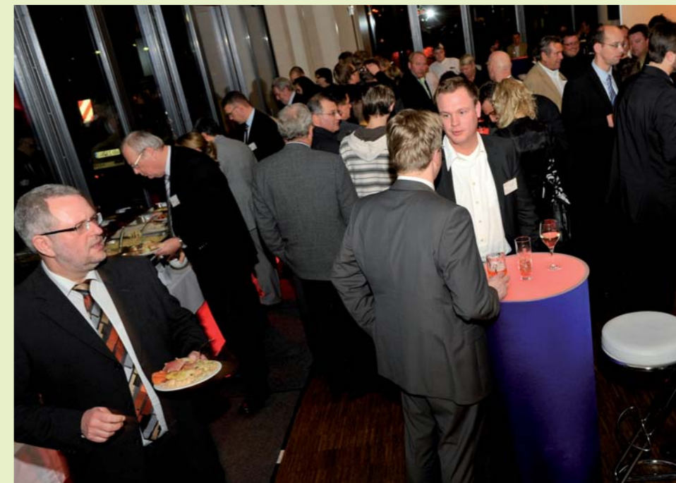
Bilder vom Abend